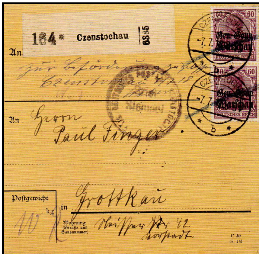
Abb. 3: Paketkarte mit Marken senkrechttes Paar Mi.-Nr. 16 a 60 Pfg., Gebühr für Paket 10 Kg., entwertet mit Stempel Czenstochau 07.07.18.