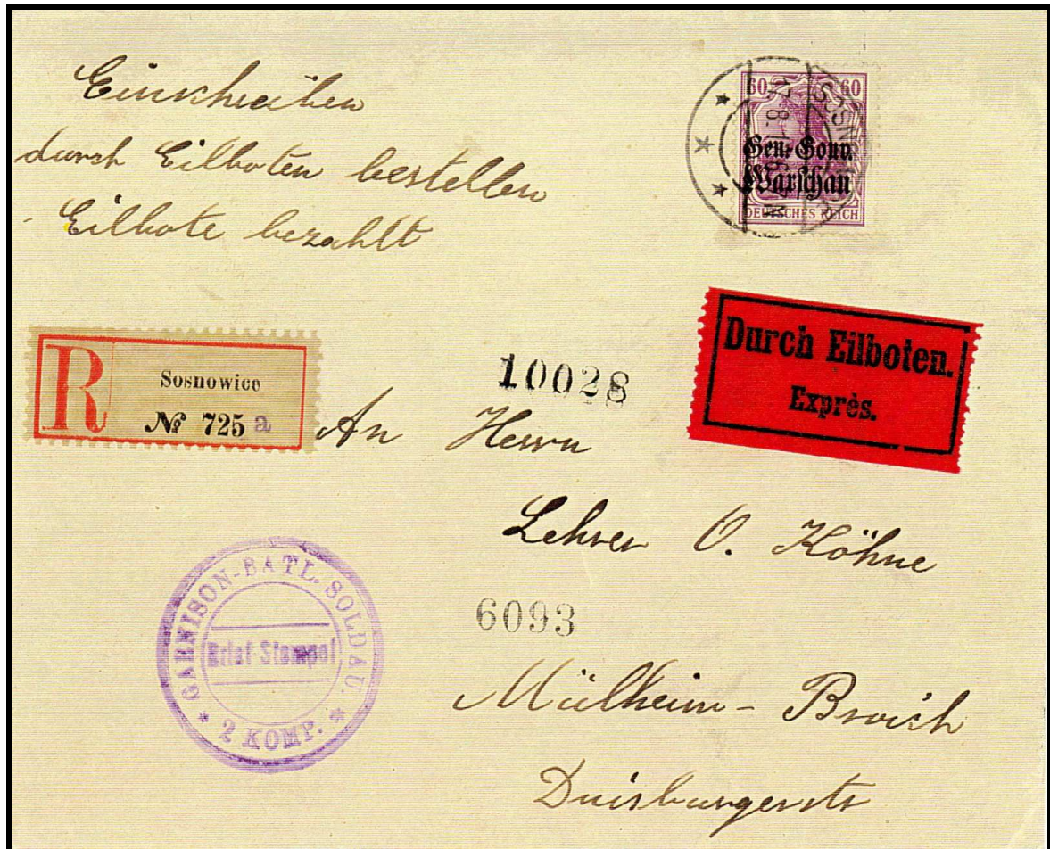
Abb. 1: Dieser Beleg zeigt den Höchstwert, Mi-Nr. 16 b, portogerecht auf Brief verwendet, Poststempel Sosnowice 17.08.17.

Das Briefporto setzt sich zusammen aus: Brief bis 20 g = 15 Pfg. Einschreibgebühr = 20 Pfg. Eilbestellgebühr = 25 Pfg. Briefporto insgesamt = 60 Pfg.